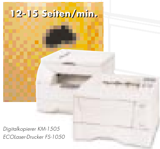
Digitalkopierer KM-1505 EcoLaser-Drucker FS-1050