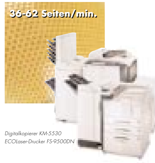
Digitalkopierer KM-5530 EcoLaser-Drucker FS-9500DN