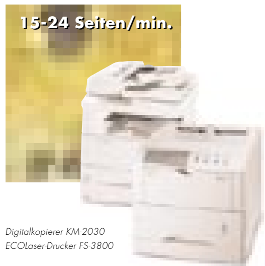
Digitalkopierer KM-2030 EcoLaser-Drucker FS-3800