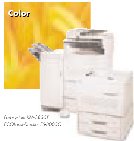
Farbsystem KM-C830P EcoLaser-Drucker FS-8000C