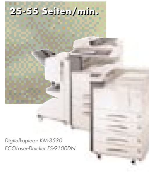
Digitalkopierer KM-3530 EcoLaser-Drucker FS-9100DN